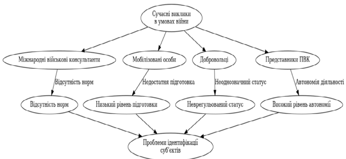
Рис. 2. Сучасні виклики в умовах війни

Схема наочно демонструє, що сучасна військова обстановка створює багатшарову проблему, яка охоплює не лише традиційних суб'єктів, таких як військо-