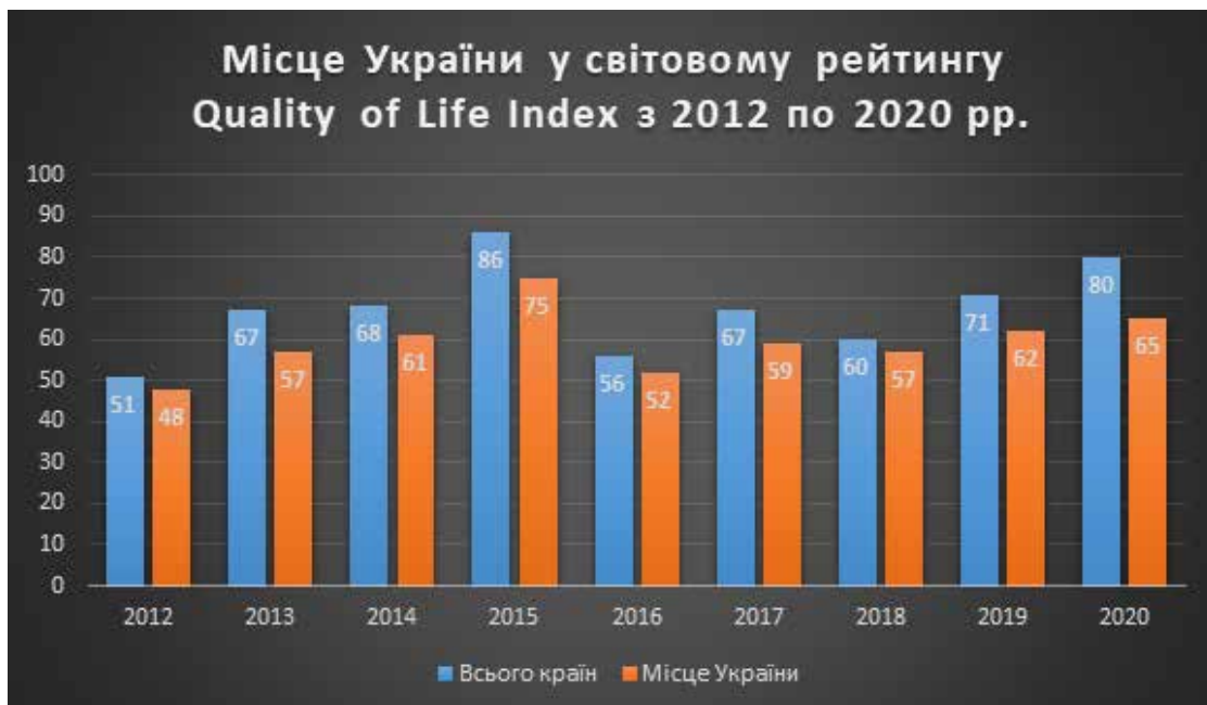
Рис. 2. Місце України у світовому рейтингу Quality of Life Index.

Держава зобов'язана ввести законодавчі ініціативи, що будуть мати на меті зміцнення інституту сім'ї. Одним із ключових, на нашу думку, кроків є визначення поняття «сім'я», її ознак на легальному рівні, з характеристикою сім'ї феодального типу. Л. Слюсар зазначає: «З набуттям Україною незалежності та зміною соціально-економічної моделі організації соціуму умови життєдіяльності української сім'ї якісно змінилися; були створені умови для її модернізації на основі постіндустріальних принципів розвитку (принципів другого демографічного переходу), зокрема й деформалізації норм і правил, їх плюралізації. Водночас країна успадкувала профіль шлюбно-сімейних процесів, що склався у попередні роки, і це значною мірою вплинуло на розвиток української сім'ї» [16, с. 82]. Цей профіль – наслідування нуклеарного типу сім'ї часів Радянського Союзу. Нуклеарна сім'я, тобто та, що включає у внутрішню структуру лише батьків та їхню дитину, з погляду емпіричних та соціологічних досліджень є про-